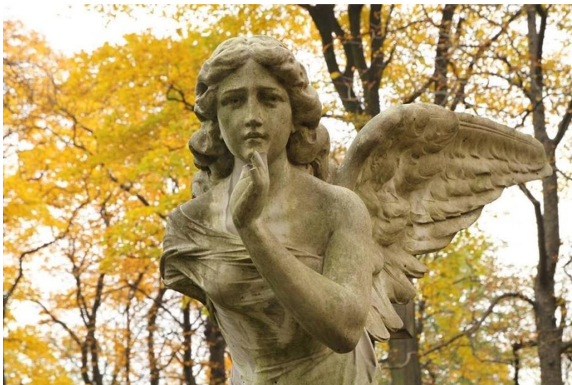
Engel op een Poolse begraafplaats

Gedachtenis van de gestorvenen Maaltijd van de Heer